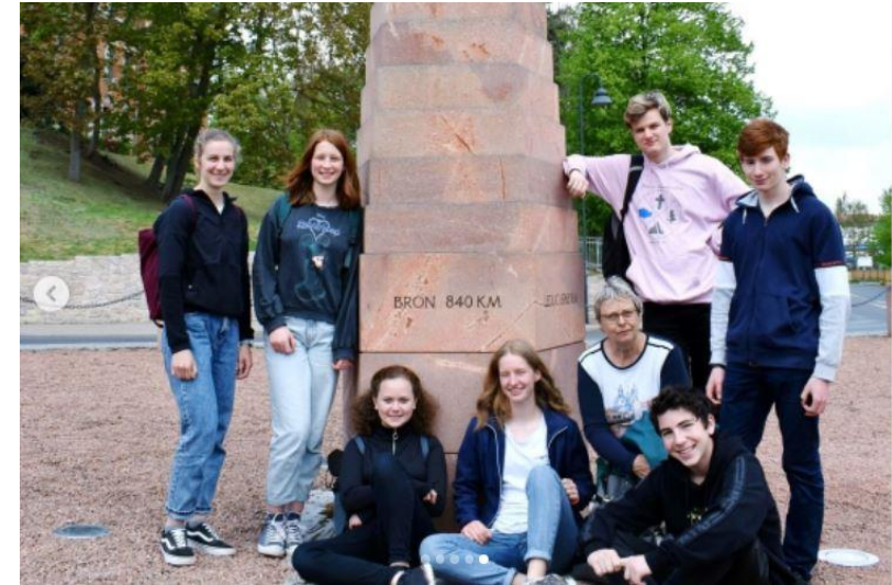
Les jeunes devant « l'obélisque »