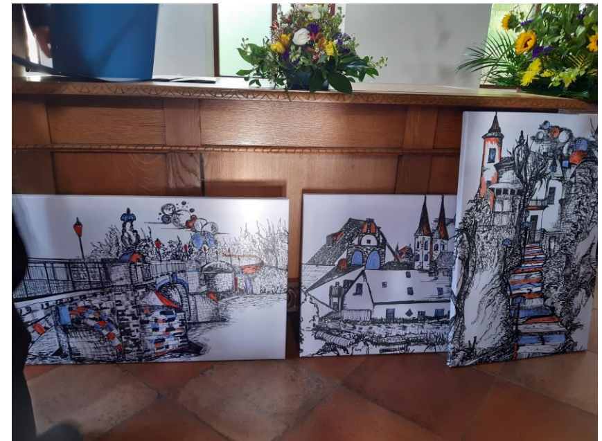
Tableaux peints par Ivonne Müller, offerts au comité Bron-Grimma