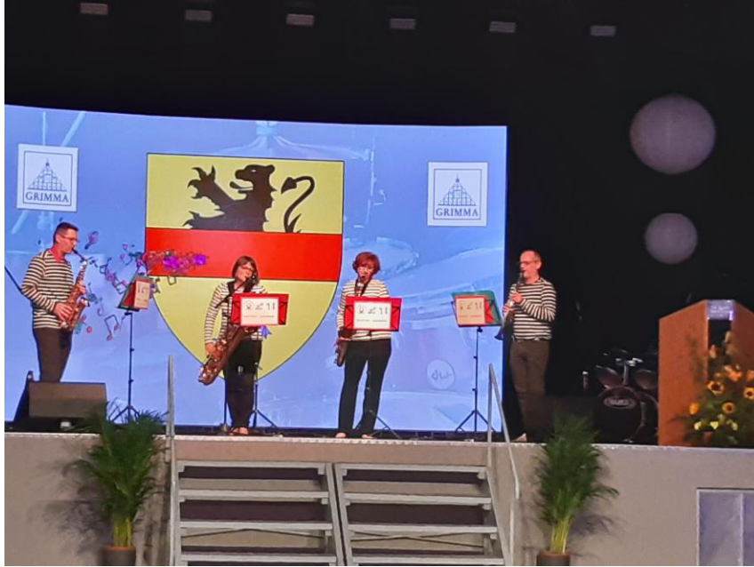
Le quatuor Alhambra de Bron