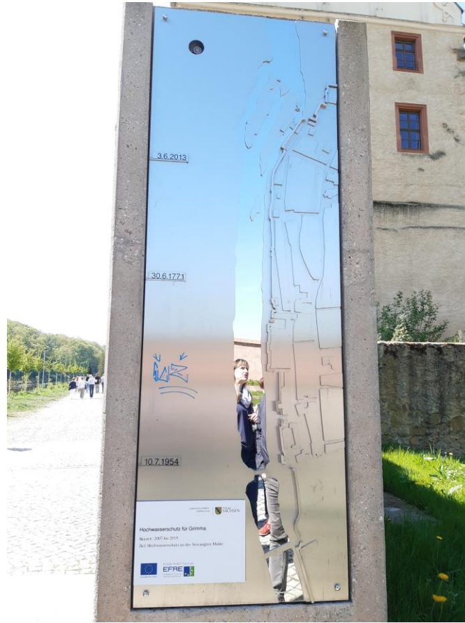
Les niveaux des inondations subies par Grimma.