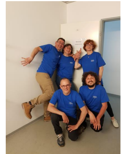
Des musiciens de l'école de musique La Glaneuse: le quatuor Alhambra