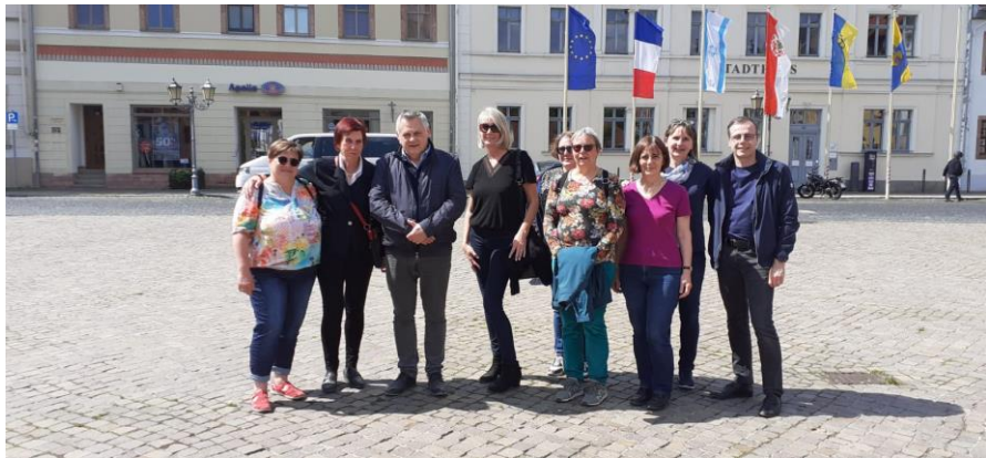
Les officiels: des représentants de la mairie de Bron et des membres du comité de jumelage Bron-Grimma

Participation d'une délégation brondillante aux manifestations organisées à Grimma pour le 50 ème anniversaire du jumelage.