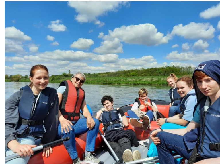
Promenade en raft sur la Mulde