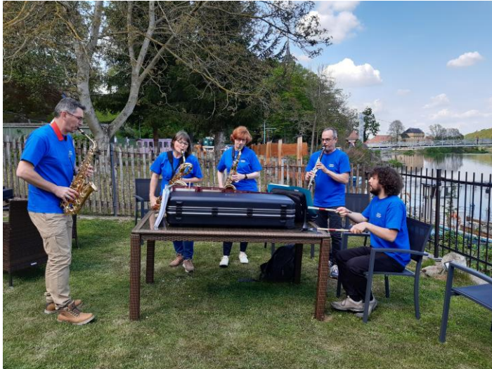
Répétition improvisée du quatuor Alhambra sur les bords de la Mulde