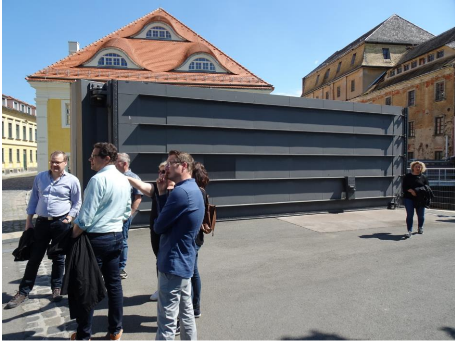
Les portes anti inondations