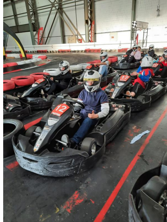
Séance de karting