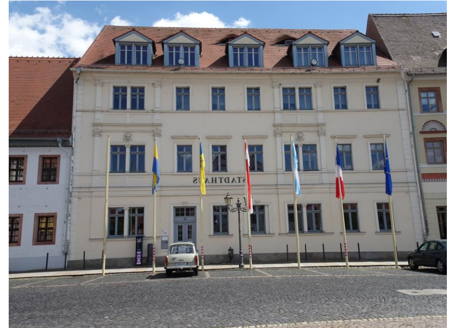
Le nouvel hôtel de ville