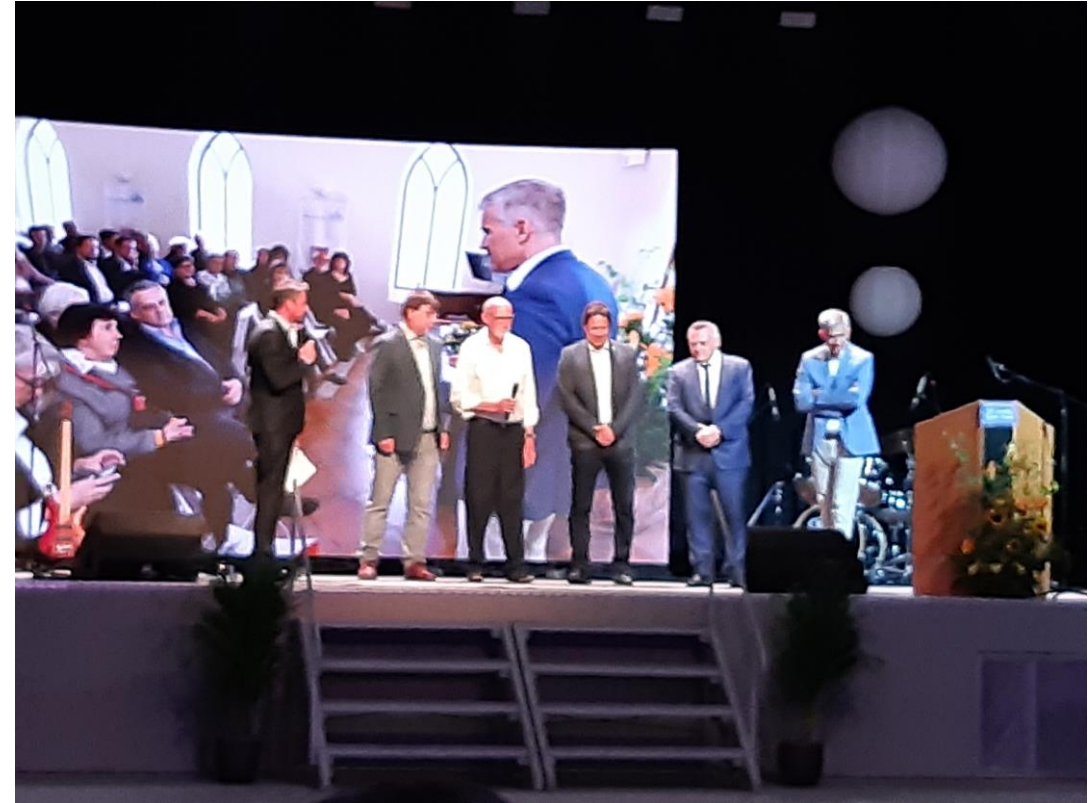
Accueil sur scène des représentants des villes jumelles de Grimma