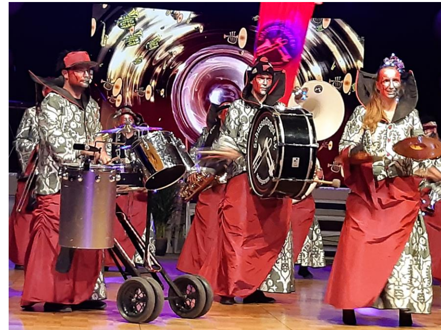
Le groupe Schussa Gugga de Weingarten