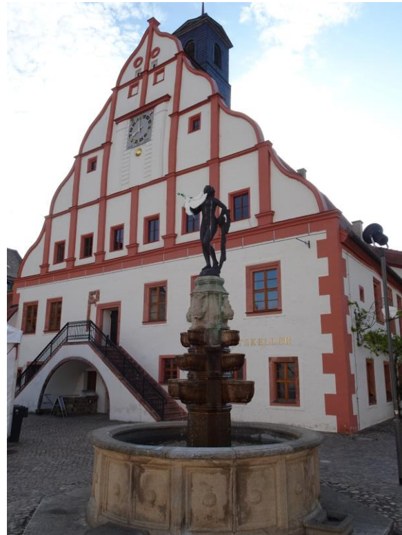
L'ancien hôtel de ville