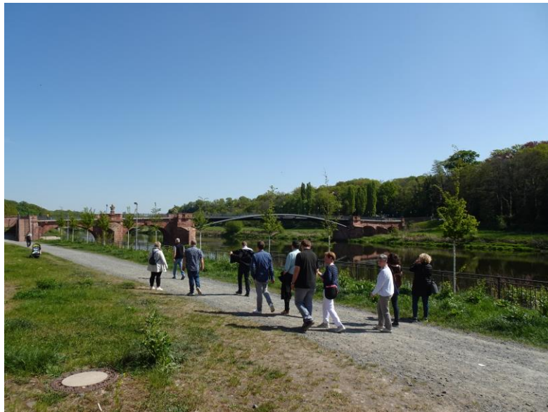
Le long de la Mulde